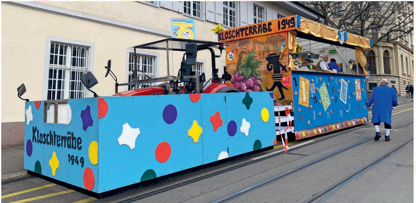
Am Steinberg auf der Route.

Die im Jahre 1949 an der Weidengasse in der Breite gegründete Kloschterräbe Clique beging in diesem Jahr seine 75. Fasnacht. Damals nannten sie sich noch Kloschterräbe-Schränzer.